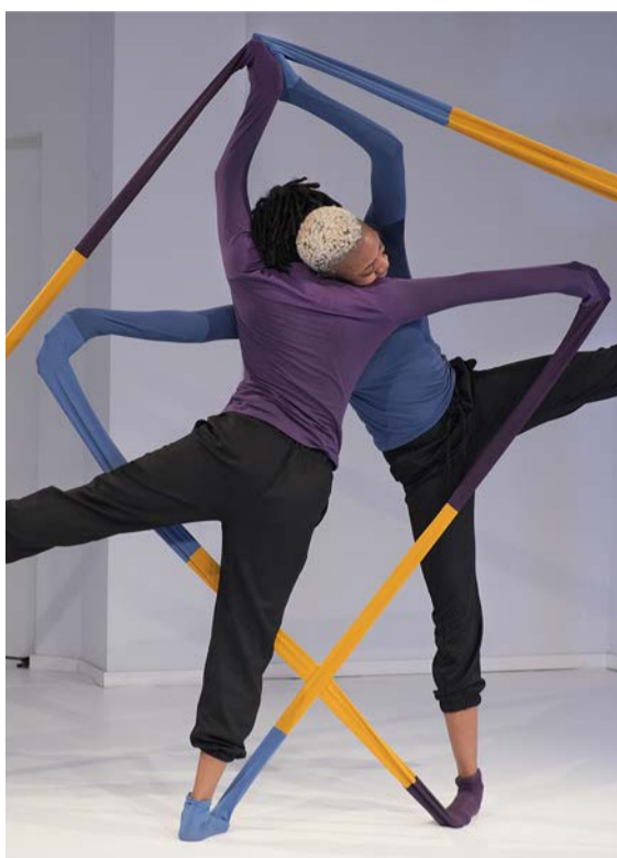
Theater: Flip-Flop*

Das Theater o.N. wird gefördert durch das Land Berlin – Senatsverwaltung für Kultur und Europa. | Einzelne Produktionen und Projekte in diesem Spielplan wurden ebenfalls gefördert vom Land Berlin – Senatsverwaltung für Kultur und Europa, vom TANZPAKT Stadt-Land-Bund aus Mitteln der Beauftragten der Bundesregierung für Kultur und Medien, vom Fonds Darstellende Künste e.V. im Rahmen des Programms NEUSTART KULTUR #TakeAction sowie vom Hauptstadtkulturfonds, der Stiftung für deutsch-polnische Zusammenarbeit und der Art Stations Foundation by Grażyna Kulczyk.